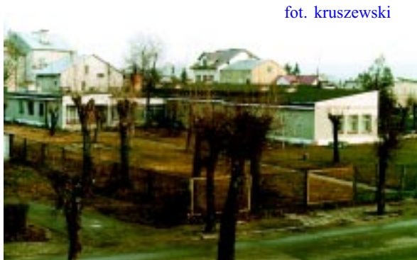
Jeszcze niedawno tak wyglądał budynek po byłym przedszkolu na miejscu którego stoi dziś nowoczesny w pełni funkcjonalny obiekt.